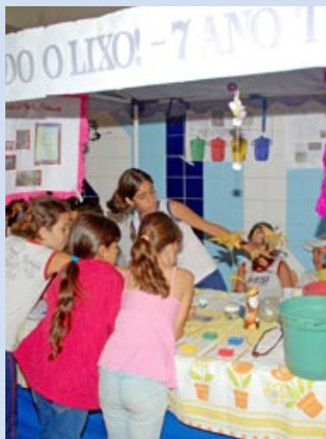
Alunos participam da Feira de Ciências