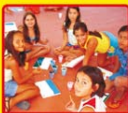
Atividades recreativas para todas as idades!!!