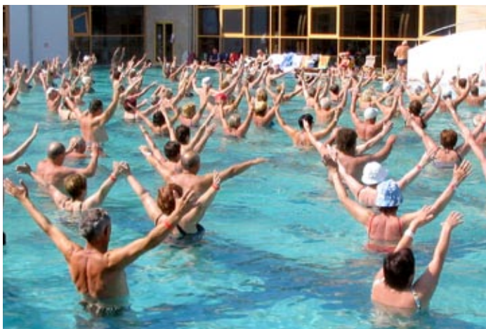
Idosos mantêm a energia e a disposição com prática de exercícios