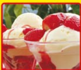
Festival de sorvete para as crianças!!!

Programação especial para todos os dias do mês!