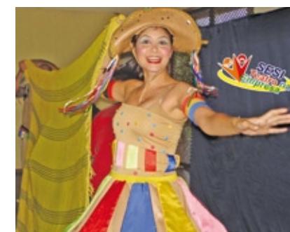
Teatro na Empresa: um dos serviços que o Sesi oferece às indústrias