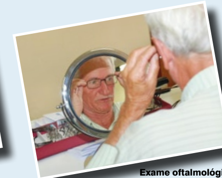
Exame oftalmológico na Ação Global

Visando reconhecer e premiar empresas que adotam políticas para um ambiente de trabalho saudável e produtivo, o Prêmio Sesi Qualidade