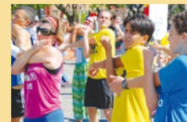
Participantes fazem alongamento antes da corrida e da caminhada

Nos meses de abril e maio, a equipe de saúde do Sesi realizou a entrega oficial de unidades móveis de odontologia ao Serviço Social da Indústria da Construção de Goiás (Seconci) e à empresa Globsteel.