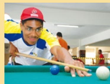
Descontração marcou as atividades do Dia do Trabalhador no Sesi

O Clube Sesi Antônio Ferreira Pacheco fez uma grande homenagem ao trabalhador em seu dia, 1º de maio. A programação incluiu torneio de truco, sinuca, bingo e shows musicais, além do sorteio de dois computadores. Na ocasião, houve também a abertura oficial da Fase Municipal dos Jogos do Sesi. Ao todo, 2.200 pessoas prestigiaram o evento no feriado.