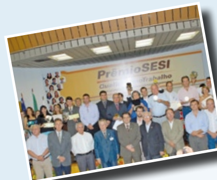
Entrega do PSQT

A parceria entre o Sesi e as indústrias na promoção de responsabilidade social empresarial (RSE) contribui na gestão dos negócios de maneira ética e responsável, na busca do equilíbrio entre os aspectos sociais, ambientais e econômicos para o sucesso empresarial.