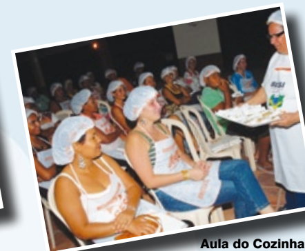
Aula do Cozinha Brasil