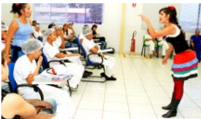
Funcionários do Grupo Sapeka assistem à peça Combate ao Tabagismo

O teatro é uma das ações educativas e preventivas do programa Sesi de Saúde, direcionado a indústrias e seus trabalhadores, que atua no estímulo às práticas de vida saudáveis, promovendo saúde dentro e fora das empresas. Produzida pela equipe de teatro do Sesi, a peça Combate ao Tabagismo