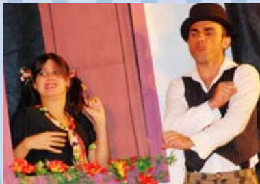
Maria Minhoca: espetáculo baseado em história da literatura infantil

• Realizado pelo Sesi Goiás de 16 de julho a 3 de agosto, no Flamboyant Shopping Center, o evento Férias Olímpicas – Jogos, Competições e Ações Recreativas mobilizou público estimado em 15.200 pessoas. Durante 19 dias, os participantes, sobretudo crianças, entraram no ritmo das Olimpíadas de Pequim, realizadas no mesmo período, por meio de programação que incluiu atividades de lazer, esporte, brincadeiras e muita diversão.