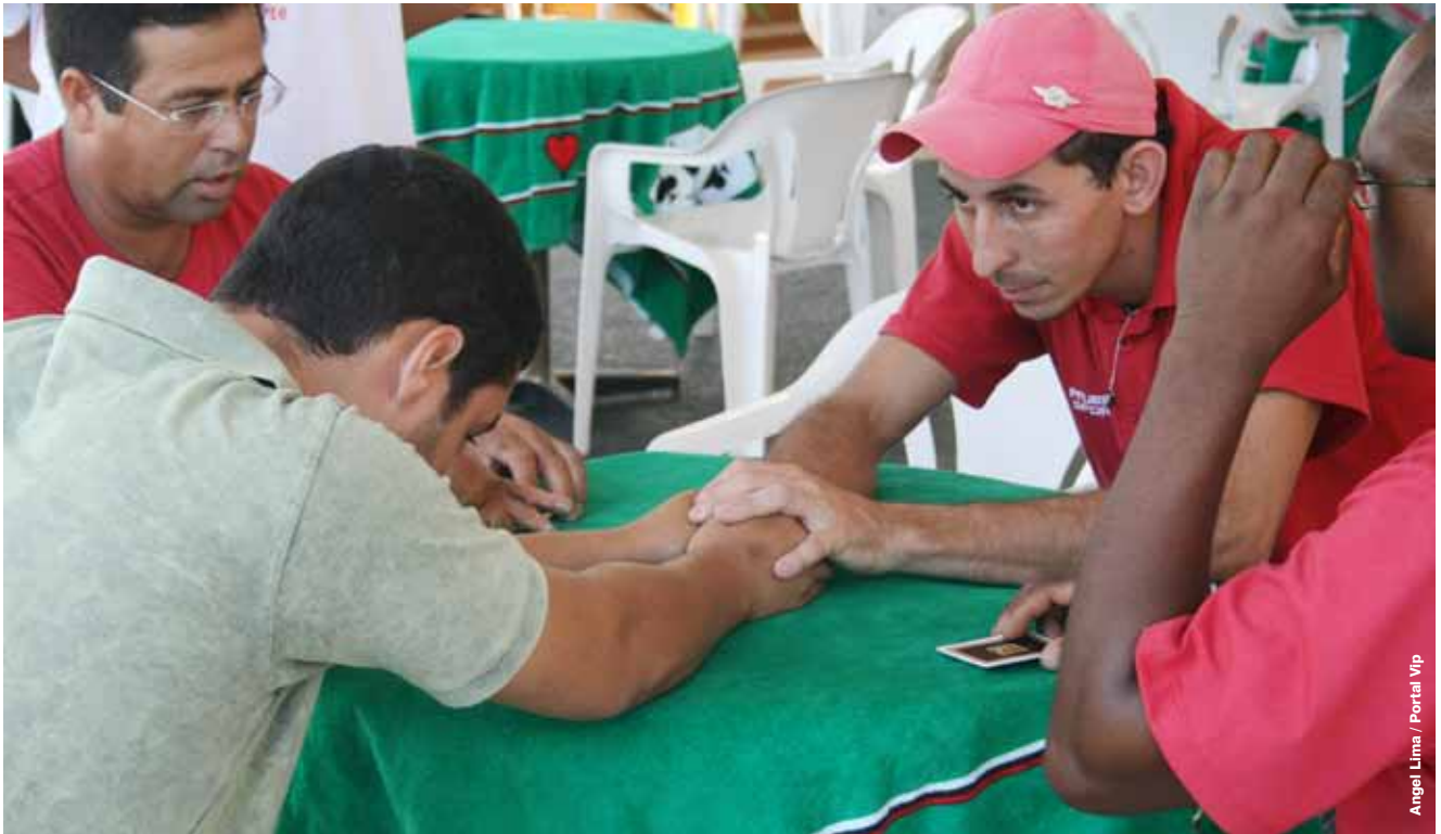
Angel Lima / Portal Vip