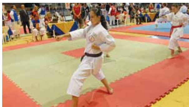
Atleta do Sesi durante disputa no Campeonato de Karatê Interestilos