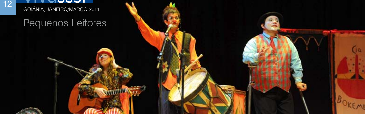
Grupo de Teatro Circense Boca, em apresentação durante a entrega do prêmio Pequenos Leitores, Grandes Escritores, promoção do Sesi