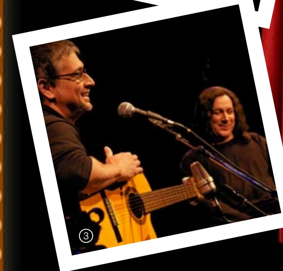
1 - Juquinha e o espetáculo Juquinha Como Você Nunca Viu 2 - Glória Rabelo traz Histórias Que Eu Não Inventei 3 - A dupla Zé Renato e Renato Braz apresenta o show Papo de Passarim