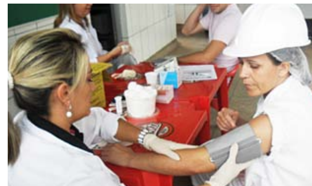
Profissionais do Sesi realizam diagnóstico de saúde dos colaboradores do frigorífico Marfrig, em Pirenópolis

Assessor de Comunicação Institucional do Sistema Fieg: Geraldo Neto Edição: Dehovan Lima Reportagens: Daniela Ribeiro, Edilaine Pazini e Valbene Bezerra Projeto Gráfico: Clarim Comunicação (clarimcomunicacao@gmail.com) Diagramação: Thatyane Mendonça Tiragem: 7 mil exemplares