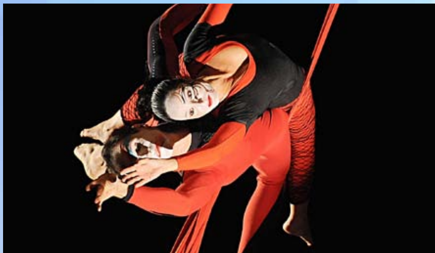
Cerimônia da Festa do Atleta, no Teatro Sesi, foi aberta com apresentação de artistas de circo