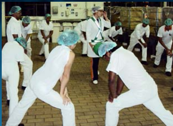
Colaboradores da Unilever participam da ginástica laboral nas dependências da empresa, durante o intervalo do trabalho