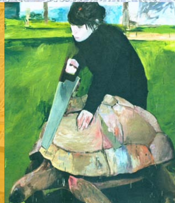
Tela Serrote, de Eduardo Berliner, um dos trabalhos da mostra

Marcantonio Vilaça inclui ainda a realização de uma mostra coletiva itinerante, que é realizada em cidades das cinco regiões do País, e a edição de dois catálogos. Os artistas se comprometem a doar uma das obras a uma das instituições que abrigaram a exposição. A escolha fica a critério dos organizadores da premiação.