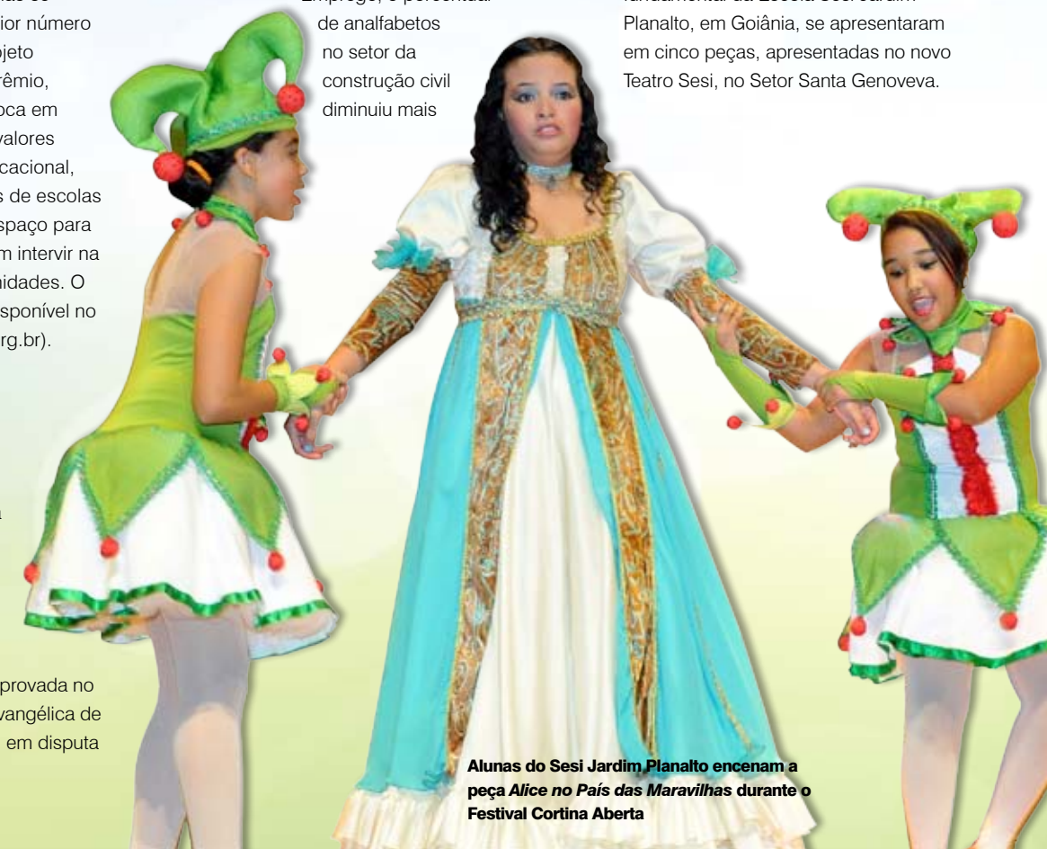
Alunas do Sesi Jardim Planalto encenam a peça Alice no País das Maravilhas durante o Festival Cortina Aberta

• Buscar expressão corporal, proporcionar maior facilidade de comunicação e despertar novos talentos. Com objetivos diferentes, vários alunos que participam do Festival Cortina Aberta, projeto cultural desenvolvido pelo Sesi há quatro anos, começam a investir na carreira artística e alguns já participam do cenário teatral de Goiânia, junto a grupos locais. Em 2010, cerca de 60 alunos do ensino fundamental da Escola Sesi Jardim Planalto, em Goiânia, se apresentaram em cinco peças, apresentadas no novo Teatro Sesi, no Setor Santa Geneveva.