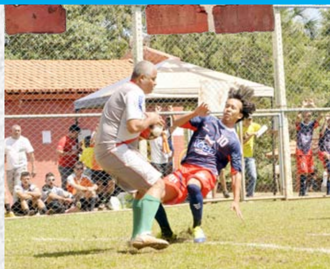
Trabalhadores e familiares participam de atividades em dia de lazer na Unidade Sesi Senai Aparecida de Goiânia