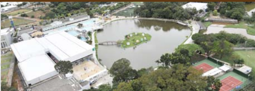
Clube Antônio Ferreira Pacheco, sede da maioria das provas dos Jogos do Sesi