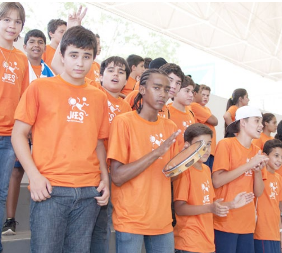
Alunos do Sesi Jaiara se divertem na torcida pela escola durante as competições

M ais de 1.250 litros de óleo e leite foram arrecadados durante a 3ª Edição dos Jogos Internos das Escolas Sesi, cujo tema este ano foi a solidariedade. Os mantimentos recolhidos durante as inscrições dos alunos atletas foram doados para entidades beneficentes. Cerca de mil crianças e adolescentes participaram das competições, realizadas de 19 a 21 de setembro no Clube Sesi Antônio Ferreira Pacheco, em Goiânia.