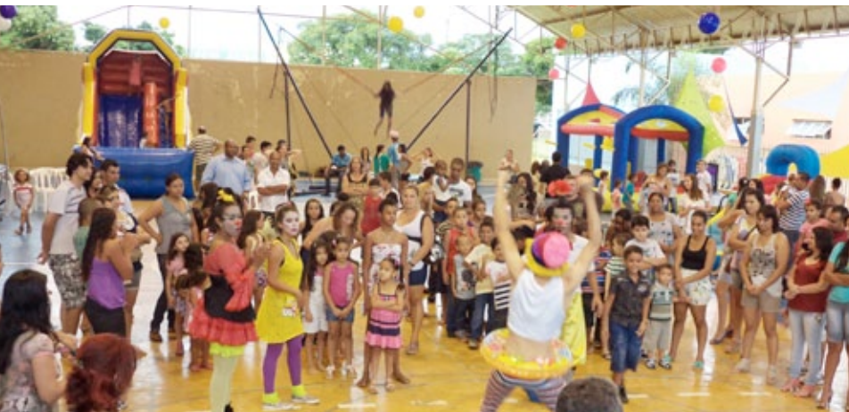
Trabalhadores da indústria Anglo American e seus dependentes na Unidade Integrada Sesi Senai Niquelândia: dia de recreação leva famílias ao clube