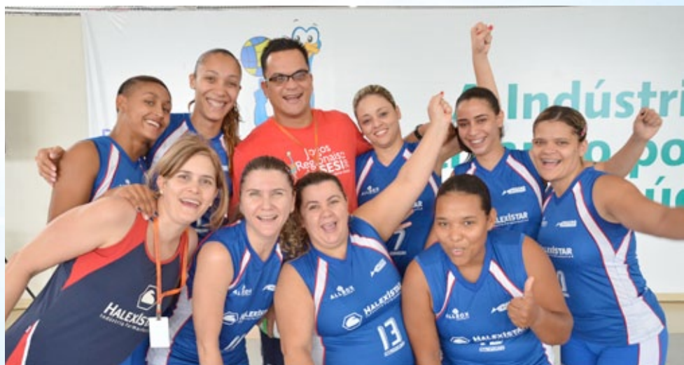
Equipe de vôlei da HalexIstar comemora vaga na etapa nacional dos Jogos do Sesi

Mesmo debaixo de muita chuva, as equipes de vôlei de praia masculino conseguiram concluir o jogo. Os goianienses dos Correios levaram prata na disputa com o time da MCR/Vale, de Mato Grosso do Sul, que venceu por 2 sets a 0. No fut-