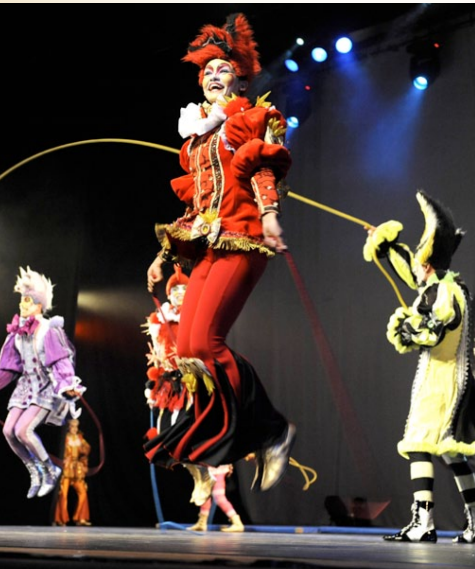
Espectáculo circense Imagem e Sonho , do grupo gaúcho Tholl, abre Jogos do Sesi em Goiânia