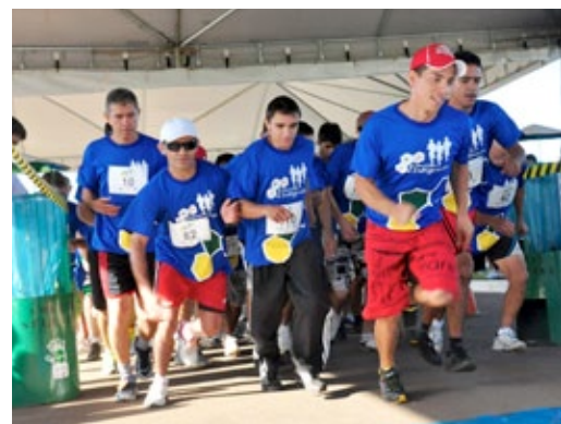
Trabalhadores participam de caminhada e corrida integrada Unilever/Cargill

Cerca de mil trabalhadores e familiares participaram da 1ª Caminhada e Corrida Integrada Unilever/Cargill, realizada em parceria com o Sesi, no dia 17 de junho. Os colaboradores da indústria também tiveram acesso ao caminhão da cultura, espaço zen e diversas atividades recreativas oferecidas pela instituição.