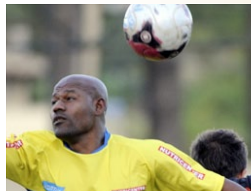
Trabalhadores-atletas de todo o País disputam medalhas nos Jogos Nacionais do Sesi, realizados pela primeira vez em Goiânia