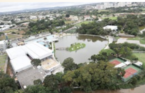
Sesi Clube Antônio Ferreira Pacheco, sede dos Jogos Nacionais: revitalização

A reestruturação do Clube Antônio Ferreira Pacheco beneficiou diretamente os trabalhadores da indústria em Goiânia, que já somam perto de 100 mil pessoas, segundo dados de 2010 da Rais (Re-