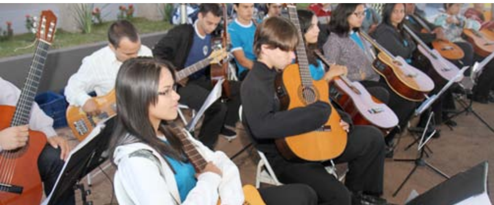
Grupo local anima evento com apresentação de música popular brasileira

Funcionários da Central Metalúrgica Catalana, em Catalão, e a população local serão beneficiados com a implantação de uma biblioteca do Sesi, inaugurada no dia 8 de julho, nas dependências da empresa. Denominado Biblioteca Aníbal Rosa – em homenagem ao educador e pai do proprietário da empresa –, o espaço proporcionará a realização de projetos e programas educacionais pelos 372 colaboradores da indústria, além possibilitar acesso da comunidade local.