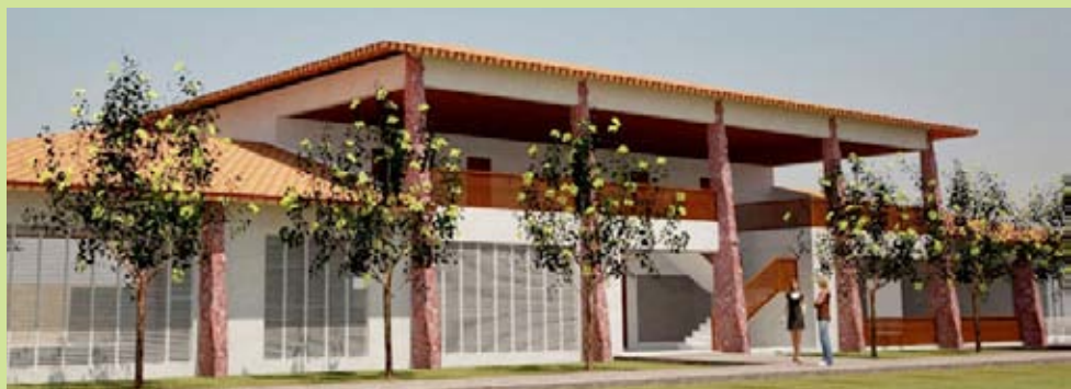
Perspectiva da ampliação do Sesi Aruanã: mais 20 apartamentos

Complexo de lazer instalado às margens do Rio Araguaia, o Sesi Aruanã ganhará mais 20 apartamentos e maior área de serviço para ampliar sua capacidade de atendimento à grande demanda de usuários, sobretudo no período de alta temporada, de junho a agosto. Um investimento de R$ 2 milhões, a ampliação já teve início e deve terminar em março de 2014, com execução pela Cosama Engenharia. Atualmente, o Sesi Aruanã possui 66 apartamentos.